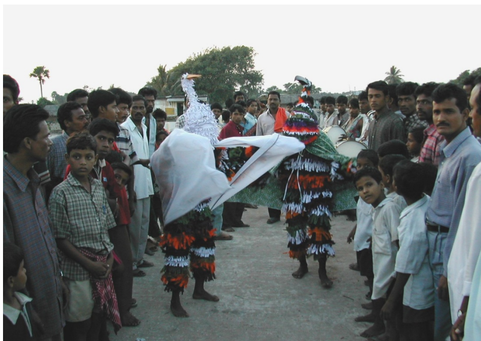
Уличные представления – ценный инструмент СЕРА, применяемый во многих странах для информирования населения о сохранении водно-болотных угодий.

Все Резолюции КС Рамсарской конвенции собраны на веб-сайте Конвенции www.ramsar.org/resolutions . Справочные документы, на которые ссылается настоящее Руководство, размещены на: www.ramsar.org/cop7_docs , www.ramsar.org/cop8_docs , www.ramsar.org/cop9/cop9_docs и www.ramsar.org/cop10-docs .