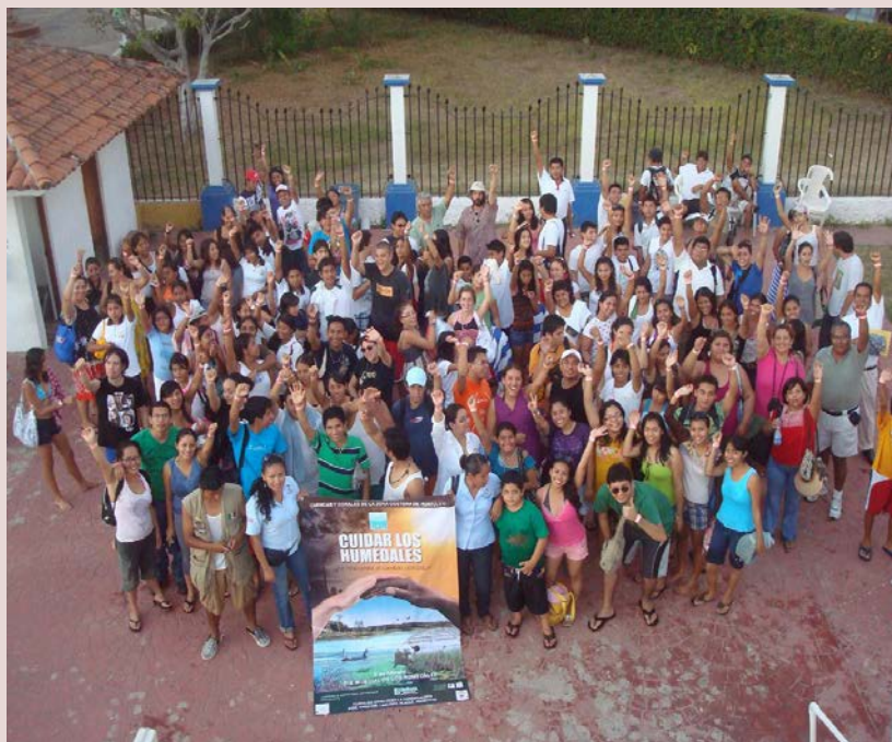
Празднование Всемирного дня водно-болотных угодий – 2010 в Национальном парке Уатуйлько (Мексика), организованное при поддержке Национального комитета по охраняемым природным территориям (Фото

Ежегодно Секретариат Конвенции рассылает организаторам мероприятий материалы к Всемирному дню водно-болотных угодий (плакаты, наклейки, проспекты, видеоматериалы и др.) по заранее выбранной теме. В последние годы особый упор делается на перевод материалов на местные языки, поэтому Секретариат также предоставляет оригинал-макеты на CD-ROM. Отчеты о ежегодных мероприятиях можно посмотреть [на указанной выше веб-странице].