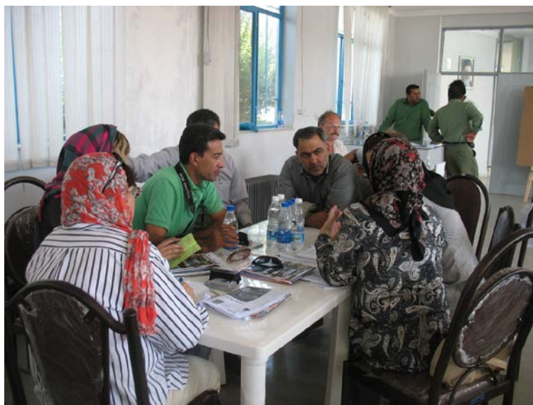
Участники совещания координаторов по СЕРА Центральной Азии и Восточной Европы (Иран, 2010 г.) – здесь отработывают методы ведения беседы на примере разговора с губернатором остана (сидит лицом к камере) об управлении ценным водно-болотным угодьем на территории остана.