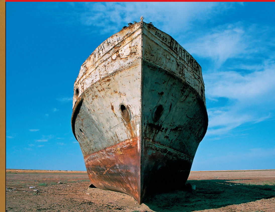
Disponibilidad de agua