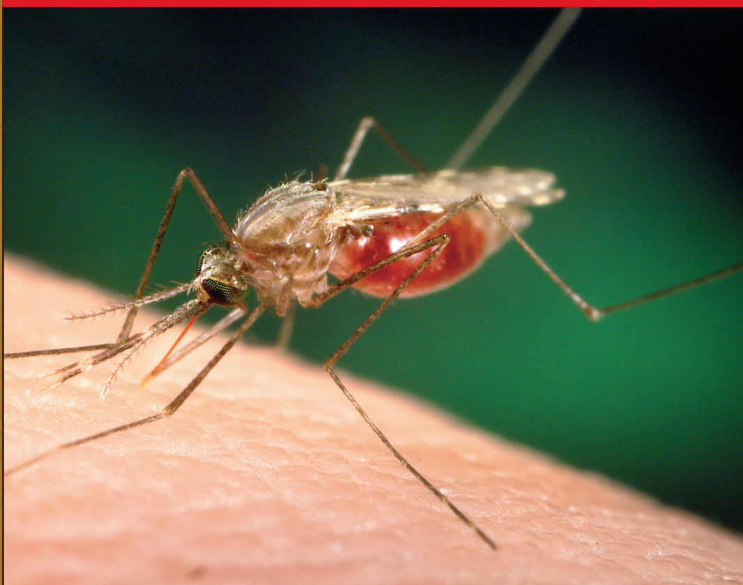
Enfermedades relacionadas con el agua