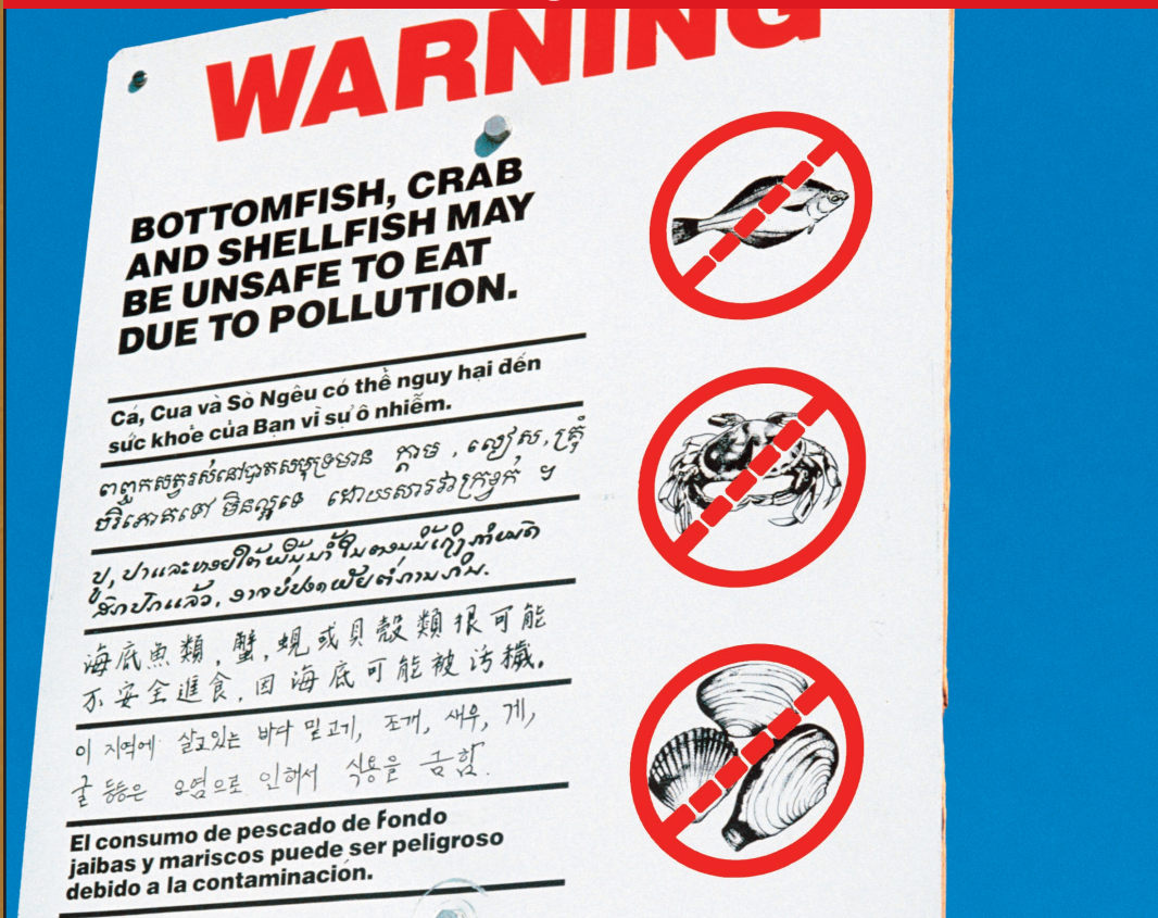
Contaminación del agua