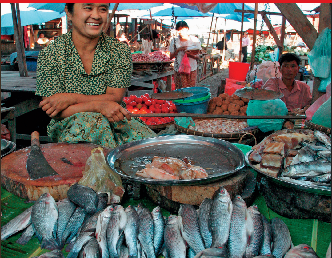
Alimentos de los humedales