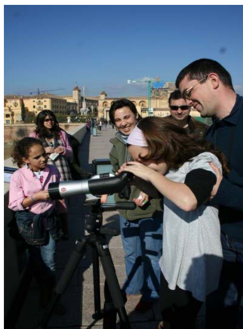
Ilustración 3: Actividad de observación de aves acuáticas