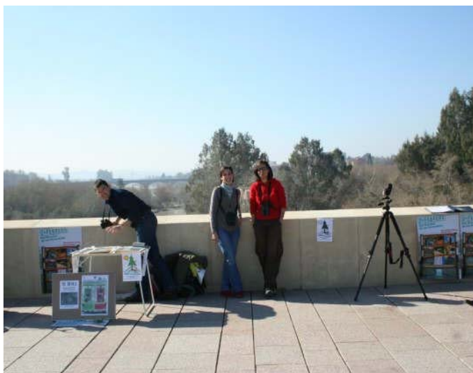
Ilustración 2: Situación general sobre el río Guadalquivir (Puente Romano)

La actividad se llevó a cabo el mismo día 2 de febrero, sábado a las 11:00 de la mañana.