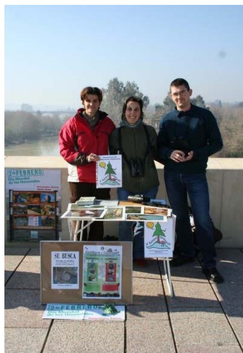
Ilustración 1: Stand informativo