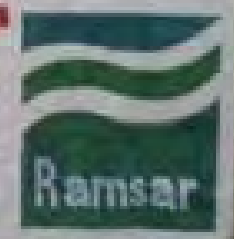
Inicio de las Actividades (una semana antes) para celebrar este día tan importante, para nosotros los pescadores y acuicultores de la región.

FEDERACION DE SOCIEDADES COOPERATIVAS KAY PALENQUE