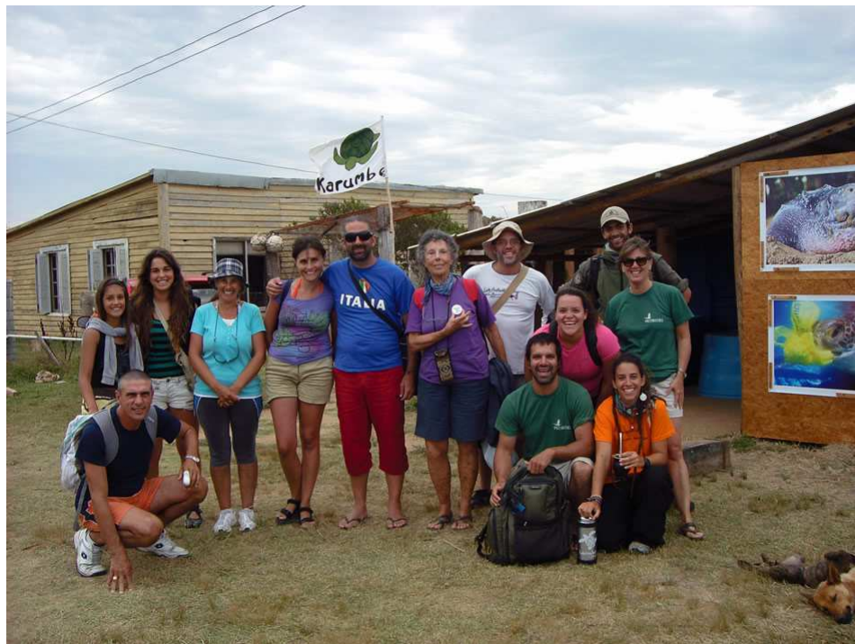
Grupo previo a la salida a Cerro Verde acompañados por el Guardaparque, técnicos de PROBIDES y KARUMBE