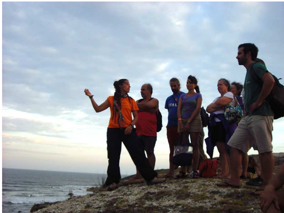
Ya sobre el Cerro Verde con la Guía de Karumbé