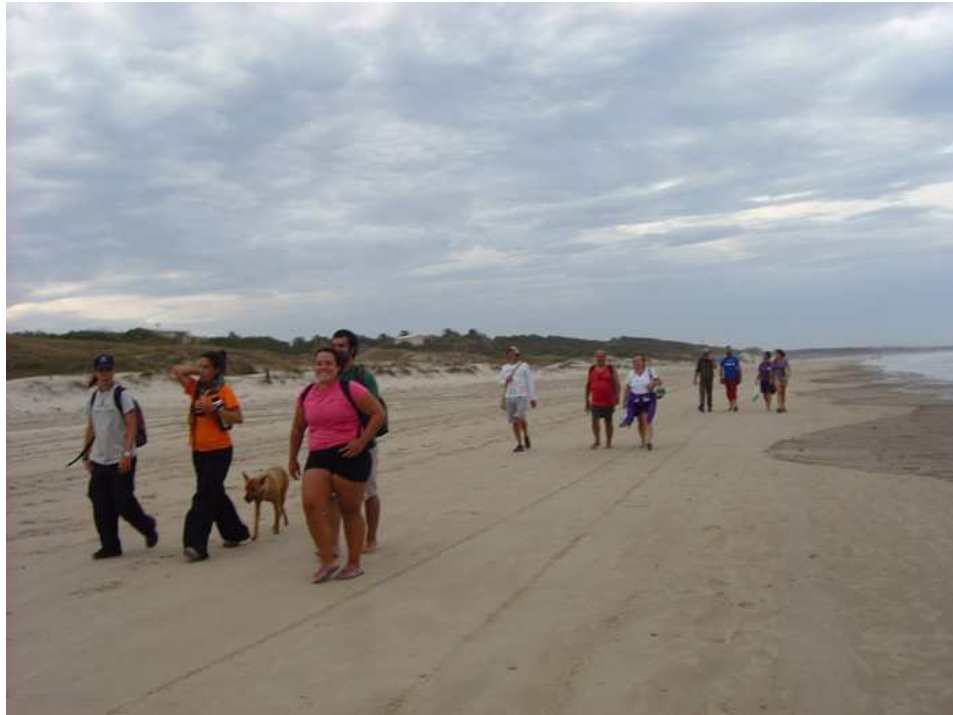
Caminata por la playa rumbo al Cerro Verde