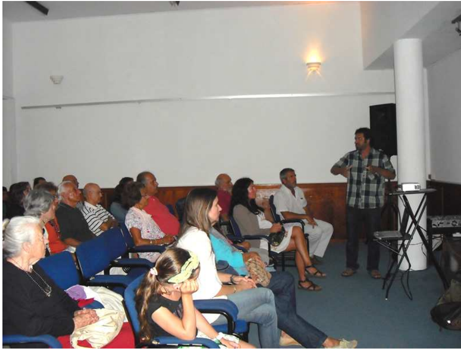
Técnicos de DINAMA y PROBIDES exponiendo sobre Cerro Verde en el marco del Día Mundial de los Humedales