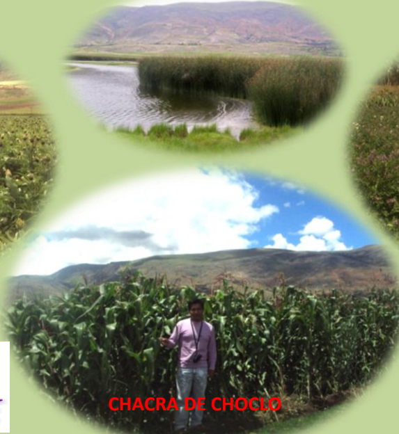
CHACRA DE CHOCLO