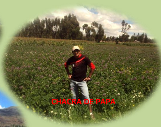
CHACRA DE PAPA