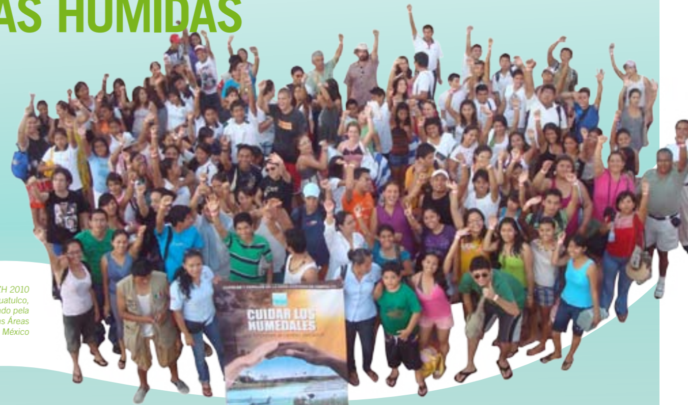
Celebração do DMZH 2010 no Parque Nacional Huatulco, um evento apoiado pela Comissão Nacional das Áreas Naturais Protegidas, México

O dia 02 de Fevereiro de 1971 marca o nascimento da Convenção de Ramsar, na cidade de Ramsar (Irão). O dia 02 de Fevereiro de 2011 irá marcar os nossos 40 anos como um tratado intergovernamental que se dedica exclusivamente aos ecossistemas: zonas húmidas.