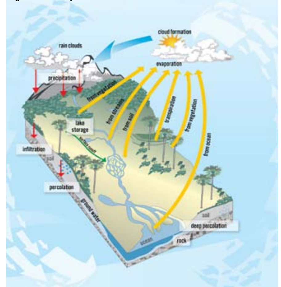
Fig. 3 The Water Cycle

claro, a perda ou degradação de florestas representa uma dupla perda, uma vez que as florestas absorvem CO 2 da atmosfera e armazenam-no. Ao mesmo tempo, as florestas oferecem grandes oportunidades de adaptação às alterações climáticas (por exemplo, através do reflorestamento de mangal) e para a mitigação deste último (por exemplo, através do florestamento e reflorestamento) - que aumentam a capacidade de resistência dos ecossistemas e das pessoas para enfrentar os desafios colocados pelas mudanças climáticas.