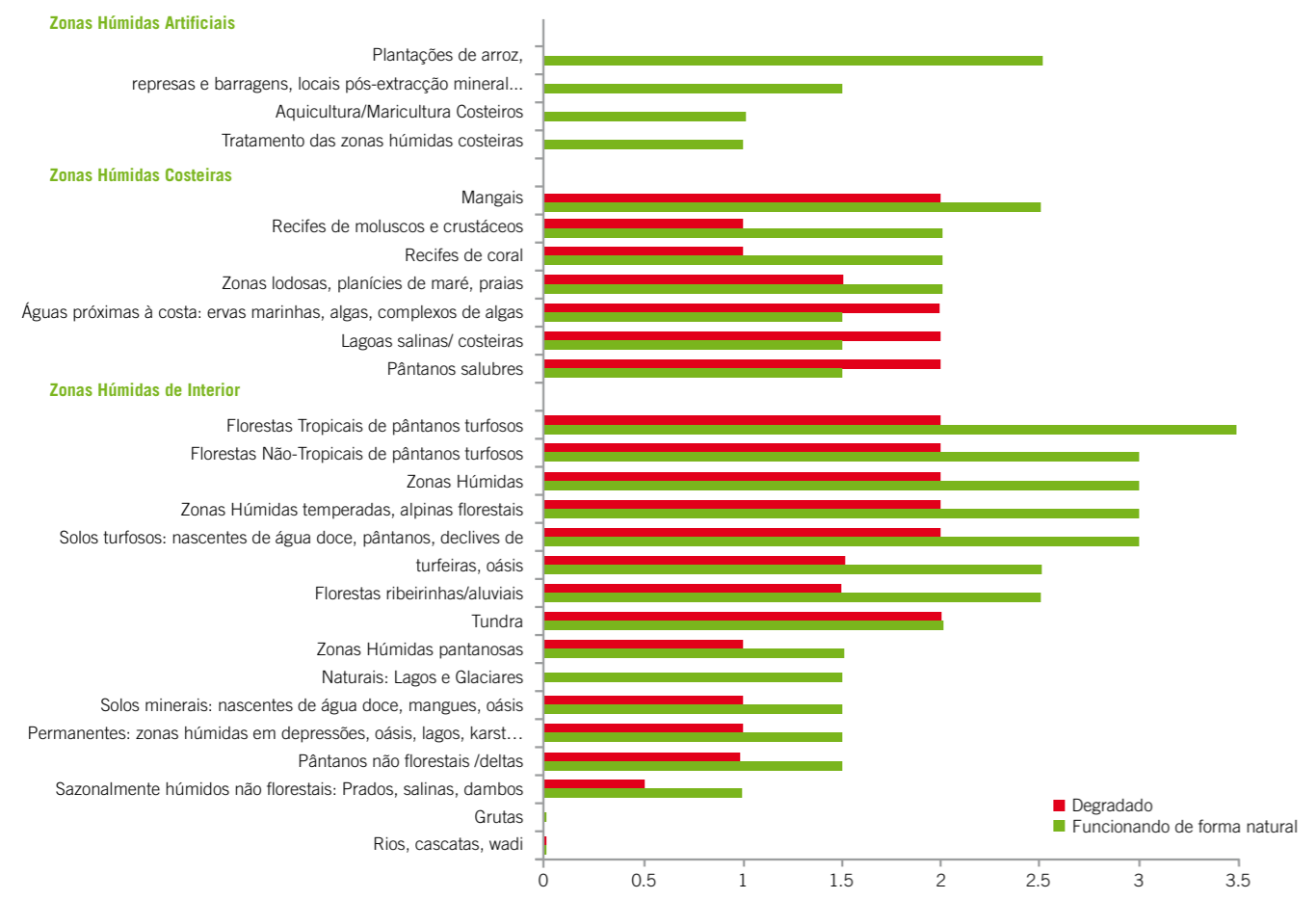
Fig. 1 Avaliação comparativa da capacidade de armazenamento de carbono à volta de diferentes tipos de zonas húmidas

de 17.575 hectares de florestas e turfeiras não florestadas. É composto por três sítios Ramsar contíguos, duas na Estónia e um na Letónia e é reconhecido pelos dois países como um local transfronteiriço, de forma que possa ser protegido como uma entidade ecológica e hidrológica. Tendo poucas pessoas próximo dos locais, a baixa intensidade na recolha de bagas, caça e pesca tem pouco impacto sobre o ecossistema do pantanal. Pessoas que moram longe do local (e, claro, a população local) beneficiam-se com o importante papel que estas zonas húmidas desempenham na manutenção e armazenamento da qualidade da água. Outra mais-valia é a diversidade de espécies vegetais e animais apoiada por turfeiras, incluindo alguns grandes mamíferos como o lobo, urso pardo e alces, e muitas espécies de aves, incluindo várias ameaçadas de extinção.