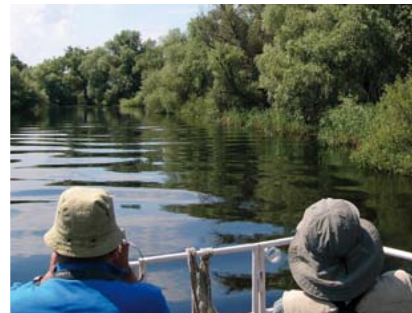
As florestas ribeirinhas desempenham importantes papéis na protecção da água.