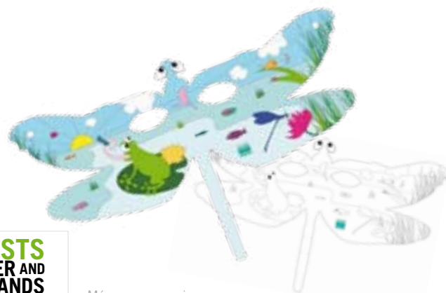
Máscaras para crianças