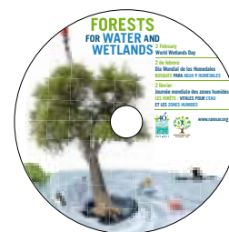
CD com todos os materiais do DMZH em alta resolução

Quer mais informação sobre o DMZH? Visite www.ramsar.org/WWD/ ou escreva para o endereço WWD@ramsar.org