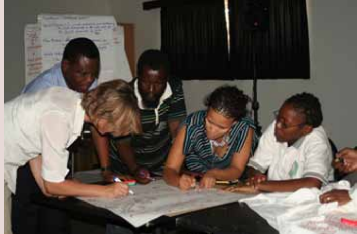
مشاركون في ورشة عمل لضباط ارتباط (CEPA) في ناميبيا عام ٢٠١٠ لبلدان جنوب افريقيا. وقد تم استخدام الأنشطة العملية في الورشة لكشف أدوات تخطيط (CEPA).

خلال الفترة ما بين ٢٠٠٩-٢٠١١، عُقد عدداً من ورشات عمل لضباط ارتباط (CEPA) على امتداد مناطق رامسار لتوفير الفرصة لتبادل المعلومات والخبرات والأهم من ذلك توفير خبرة التدريب العملي في تخطيط (CEPA). المهمة الرئيسية لضباط الارتباط فيه.