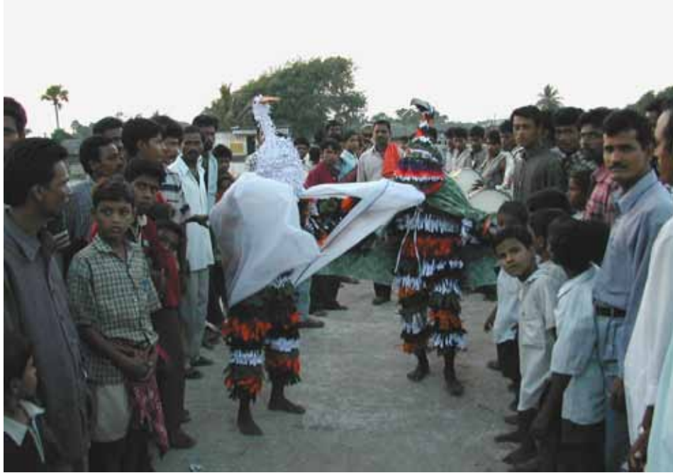
مسرح الشارع أداة قيمة تستخدمها (سيبا) في العديد من البلدان لإيصال رسالة المحافظة على الأراضي الرطبة للمجتمعات المحلية.

جميع قرارات مؤتمرات الأطراف المتعاقدة لرامسار متوفرة على موقع الاتفاقية www.ramsar.org/resolutions . والوثائق الرئيسية المشار إليها في هذه الكتيبات متوفرة على المواقع www.ramsar.org/cop7-docs ، www.ramsar.org/dop8-docs و www.ramsar.org/cop9-docs و www.ramsar.org/cop10-docs