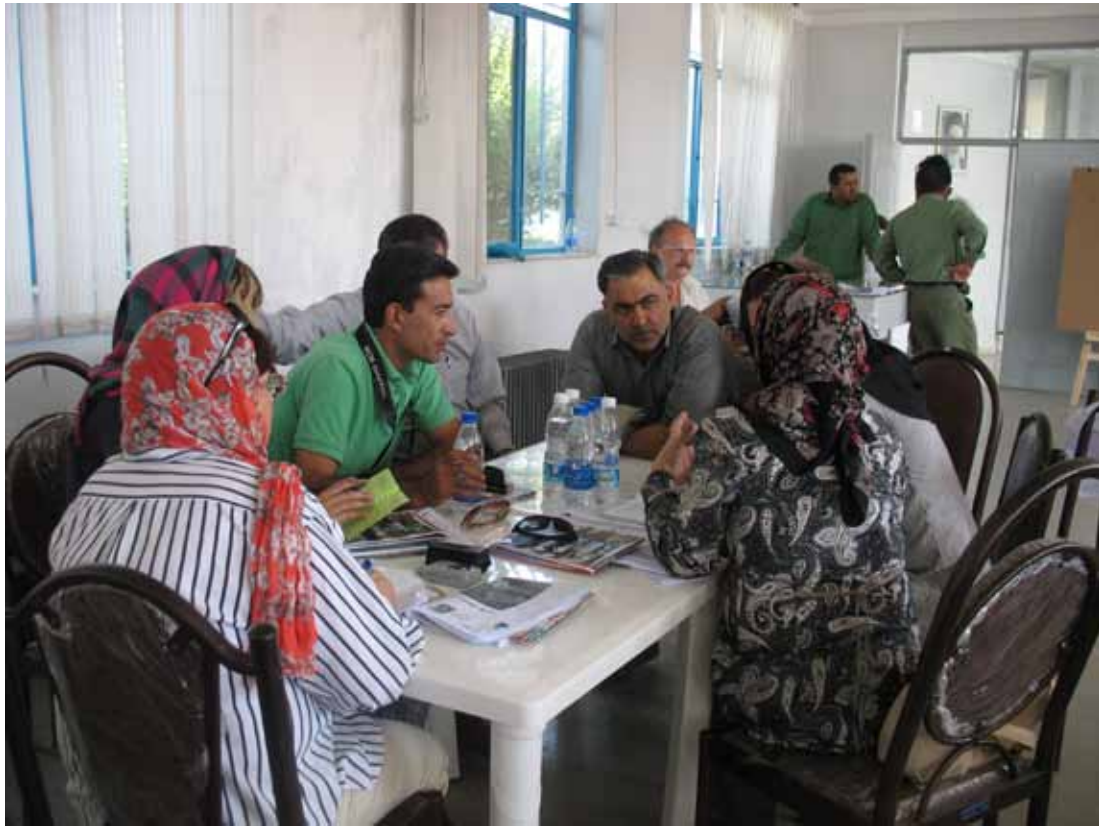
مشاركين في ورشة عمل ضباط ارتباط (CEPA) الوطنيين لبلدان وسط آسيا وشرقي أوروبا الذي عقد عام ٢٠١٠ في إيران- يتدربون على أساليب مقابلة المعنيين عن طريق مقابلة حاكم المنطقة (بمواجهة الكاميرا) حول إدارة الأراضي الرطبة الهامة في المنطقة