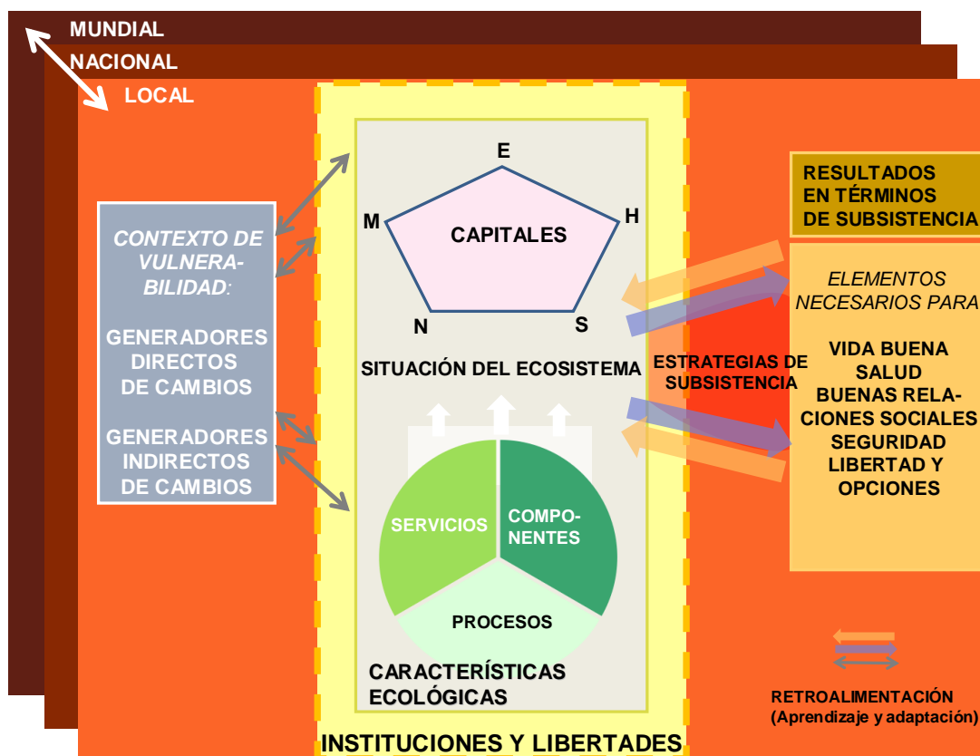
Figura 2. Marco para la evaluación integrada de la interrelación entre los humedales y los medios de subsistencia (basado en el marco conceptual para los ecosistemas y el bienestar humano de la Evaluación de los Ecosistemas del Milenio)