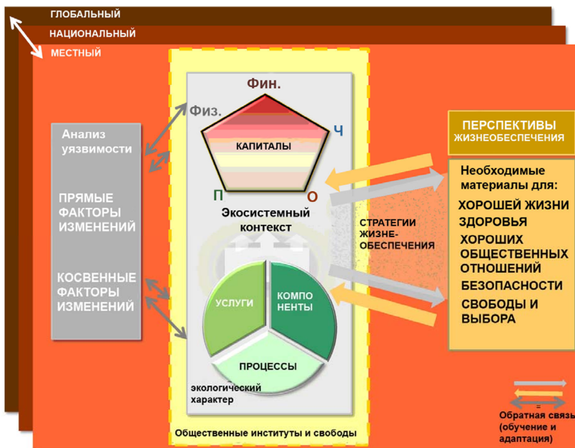
Рис. 2. Схема комплексной оценки взаимосвязей водно-болотных угодий и жизнеобеспечения (на основе концептуальной схемы «экосистемы и благосостояние человека» в отчете Оценка экосистем на пороге тысячелетия)