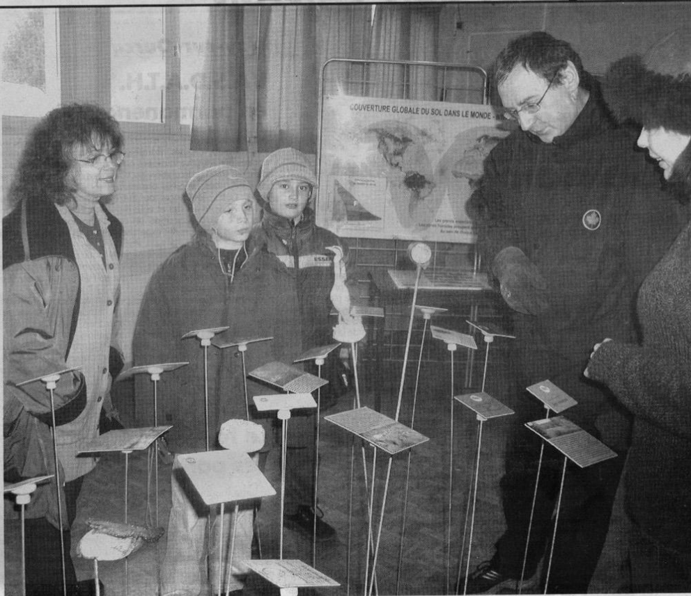
A la découverte de nos amis les oiseaux