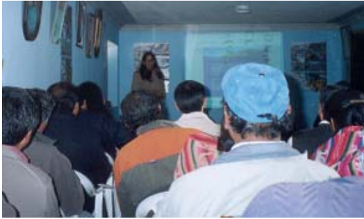
Foto 01: Conversatorio Nominación del Humedal Lucre - Wakarpay como Sitio Ramsar