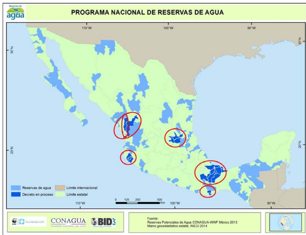
Figure 3. Réserves d'eau possibles et zones de travail pilotes

PROGRAMME NATIONAL DE RÉSERVES D'EAU Reservas d'eau Frontière avec un autre pays Décret en cours Frontière de l'État