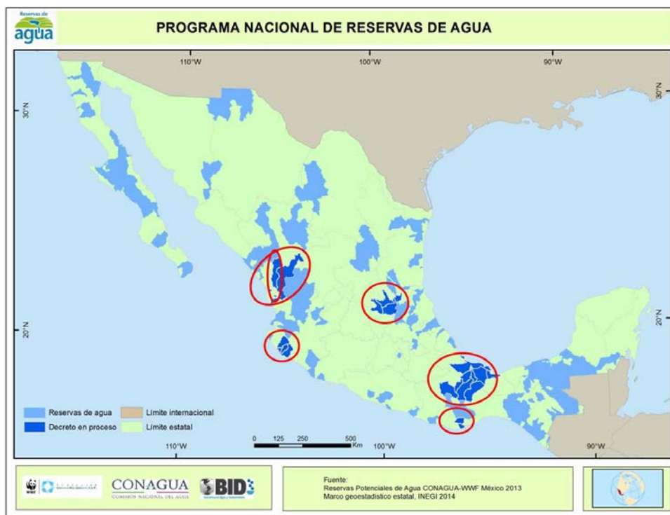
Figura 3. Reservas potenciales de agua y zonas de trabajo piloto.