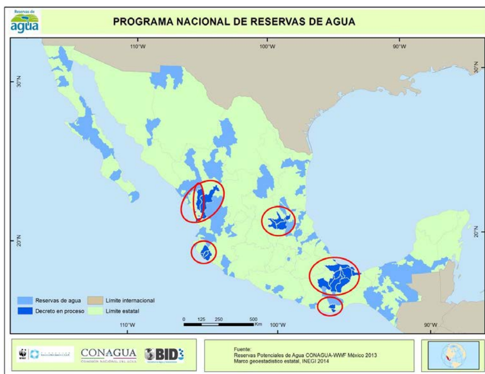
Figure 3. Réserves d'eau possibles et zones de travail pilotes

PROGRAMME NATIONAL DE RÉSERVES D'EAU Réserves d'eau Frontière avec un autre pays Décret en cours Frontière de l'État