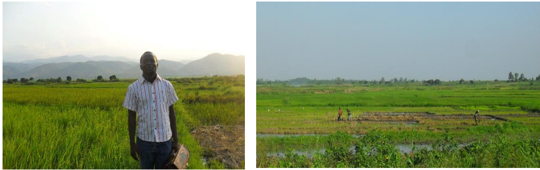
Un champ du riz moyennement inondé à Kitete.