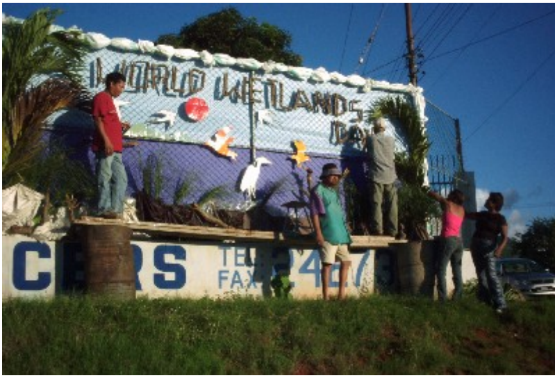
Secondary school students in Port Louis erecting the WWD exhibit at Roche Bois roundabout

3. Distributions of 10,000 pamphlets (pictured on the left) in the form of bookmarks to the general public by the Secondary School children in the Port Louis. The pamphlets highlighted the importance of wetlands. The goods and services provided by wetlands, with special reference to our local Ramsar site.