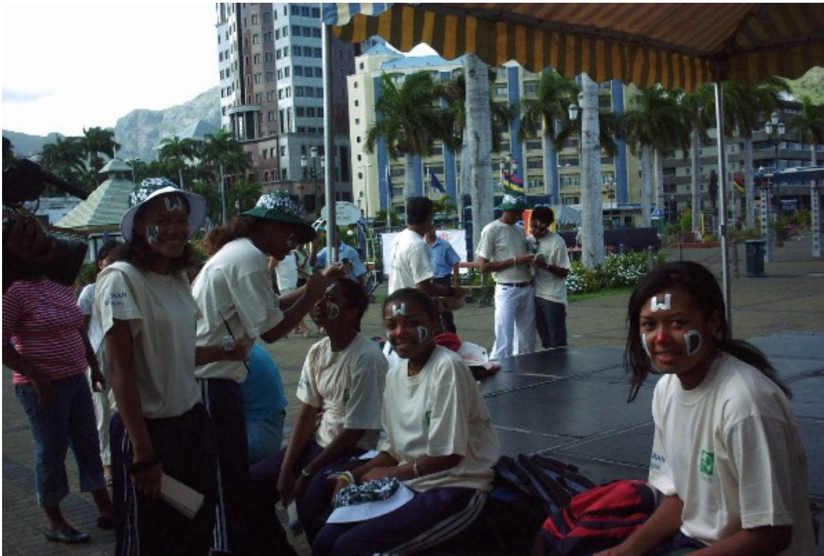
The team decorating their faces with the letters WWD in preparation for distributing the bookmarks

3. Distributions of 10,000 pamphlets (pictured on the left) in the form of bookmarks to the general public by the Secondary School children in the Port Louis. The pamphlets highlighted the importance of wetlands. The goods and services provided by wetlands, with special reference to our local Ramsar site.