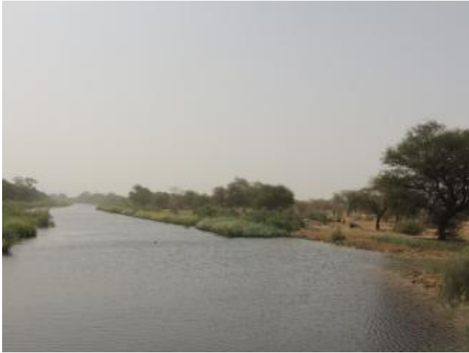
Réserve Spéciale de Faune de Ndiaël

Le Gouvernement du Sénégal a retiré la Réserve spéciale de faune du Ndiaël du Registre de Montreux. Le site Ramsar a été inscrit au Registre en 1990 après que des menaces sur ses caractéristiques écologiques aient été identifiées.