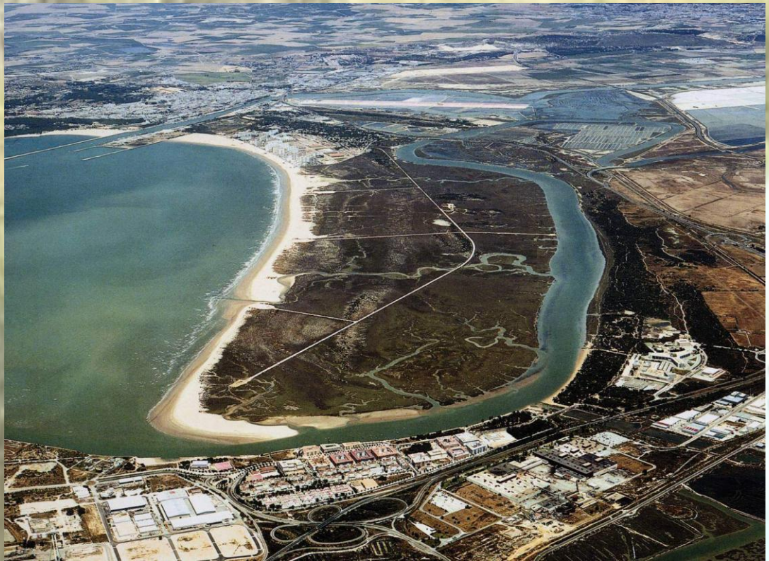
Vista aérea del Parque Metropolitano ubicado en el corazón de la Bahía de Cádiz

Se trata de un espacio biofísico dominado por la desembocadura del río San Pedro y los terrenos a ella asociados en forma de flecha litoral, marisma, cordón dunar y pinar, que se encuentran íntima e indisolublemente unidos en su origen y evolución.