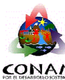
SECRETARÍA EJECUTIVA REGIONAL Cusco-Puno-Apurímac