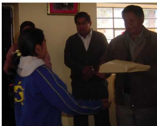
Concurso de Dibujo: Premiación