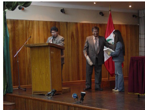
Seminario: Clausura y entrega de presentes