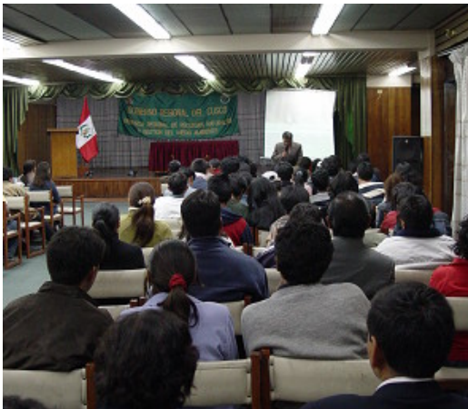
Seminario: exposición CPHLH