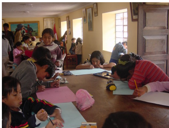
Concurso de Dibujo: niños participantes