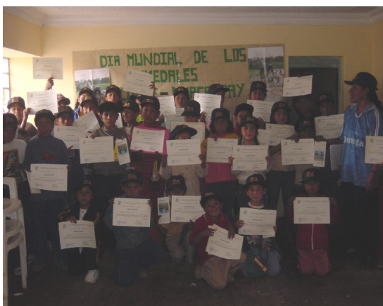
Concurso de Dibujo: Clausura