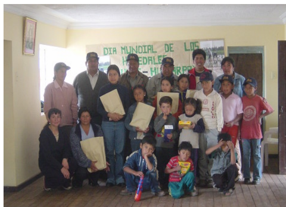
Concurso de Dibujo: Ganadores