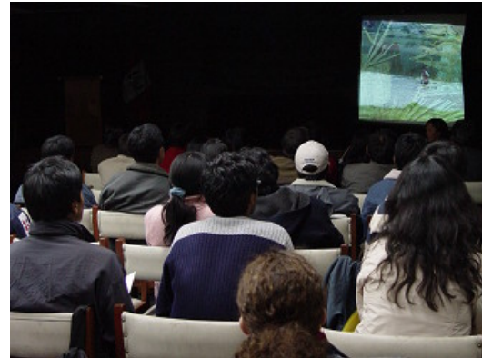
Seminario: presentación multimedia