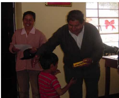
Concurso de Dibujo: Premiación