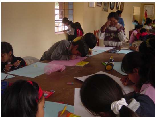
Concurso de Dibujo: niños participantes