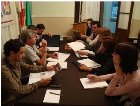
Foto: Comité Regional Pesquero del Departamento General Obligado (se reúne mensualmente)