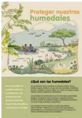
Publicación: Boletín “Proteger Nuestros Humedales” diseñado especialmente para escuelas