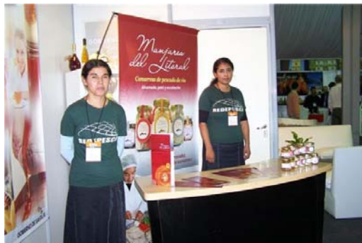
Foto: algunos de los puntos de encuestas realizadas por parte de los propios vendedores de producto, Feria Internacional de Alimentos Rosario