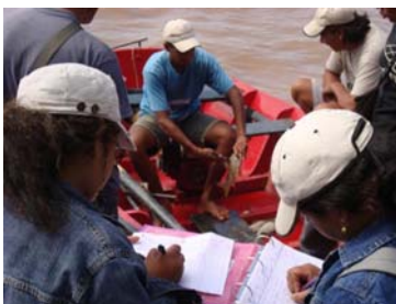
Foto: Capacitación para monitores y monitoras.