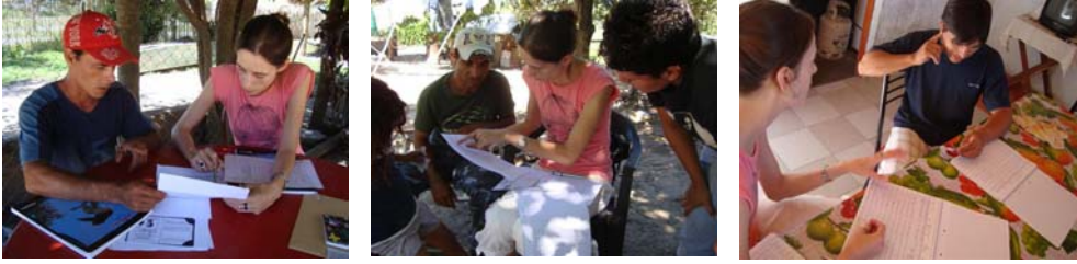
Foto: algunos de los monitores capacitados que trabajan en el registro diario, Provincias de Chaco y Santa Fe.