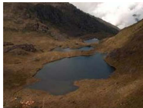
Parc national Chirripó, Zone humide d'importance internationale Turberas de Talamanca, Costa Rica

Les pays d'Amérique du Sud et d'Amérique centrale présentant des écosystèmes des hautes Andes ont compris l'impact des tourbières sur les communautés locales.