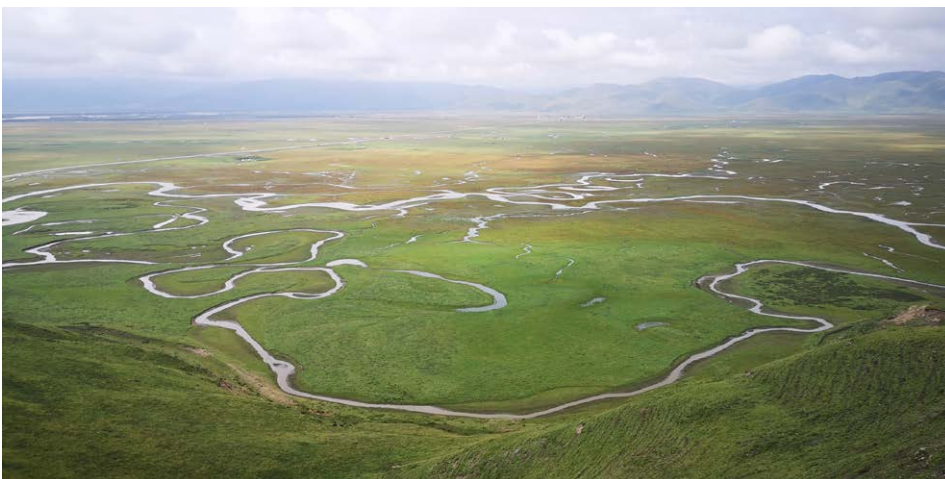
Tourbières de la Zone humide d'importance internationale Gansu Yellow River Shouqu, Chine

Cette fiche d'information est mise à disposition par la Convention de Ramsar sur les zones humides 2021. Les informations sont tirées de diverses publications de la Convention de Ramsar sur les zones humides, y compris son Groupe d'évaluation scientifique et technique ou d'autres sources d'information pertinentes.