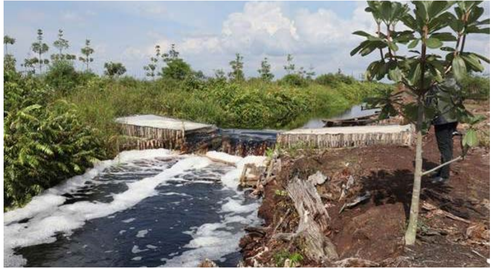
Comblement d'un fossé de drainage et paludiculture dans les environs de la Zone humide d'importance internationale Parc national Berbak, Indonésie