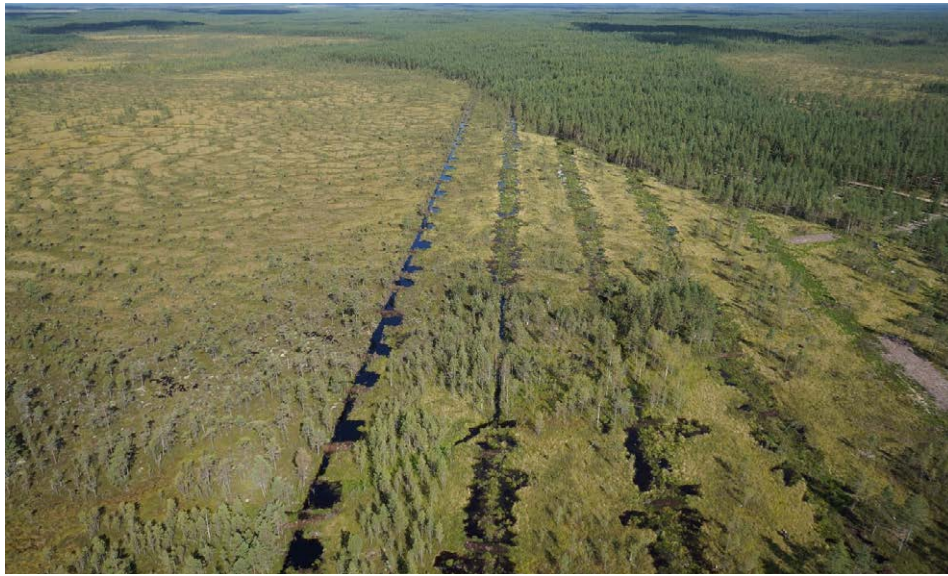
Restauration des limites d'une tourbière au sein de la Zone humide d'importance internationale du parc national Kauhaneva-Pohjankangas, Finlande

Les tourbières représentent 30 % de la superficie de la Finlande. Bien que la superficie des tourbières du Canada et de la Russie soit plus grande en termes absolus que celle de la Finlande, les tourbières représentent en valeur relative 12 % et 8 % de leur superficie respective.