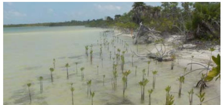
Reboisement de palétuviers rouges

Cette fiche d'information est mise à disposition par la Convention de Ramsar sur les zones humides 2021. Les informations sont tirées de diverses publications de la Convention de Ramsar sur les zones humides, y compris son Groupe d'évaluation scientifique et technique ou d'autres sources d'information pertinentes.