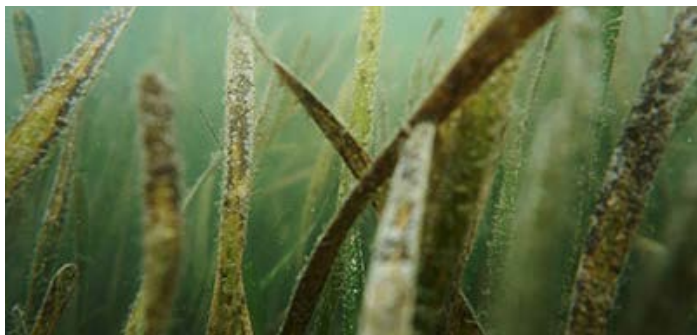
Le programme de l'estuaire de la baie de Tampa, « Herbe à tortue » ( Thalassia testudinum )